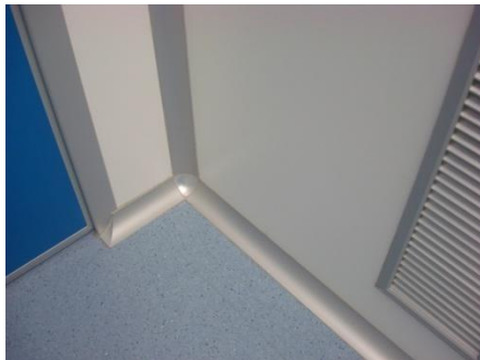
figura 3.1: uniones paredes/pisos (CVTTH).

Los materiales a usar deben ser lisos: mosaico continuo, sin uniones, pvc, resina epoxi; las paredes tienen que ser lisas; las uniones con el suelo, redondeadas.